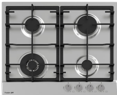
Table de cuisson Power